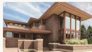
普遍の美 Classic Style

自然の姿をカタチにした3つのベーススタイル。自然界の美しさを取り込んだ「クラシック」、移ろいゆく四季を楽しむ「ラグジュアリー」、普遍的な美しさと現代の暮らしの融合した「モダン」。住まう人のライフスタイルに合わせたスタイルからお選び頂けます。