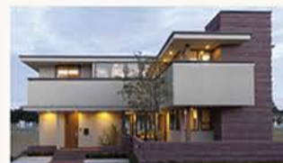
優雅な佇まい Luxury Style