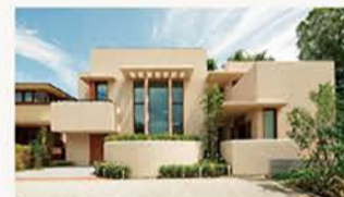
現代との融合 Modern Style